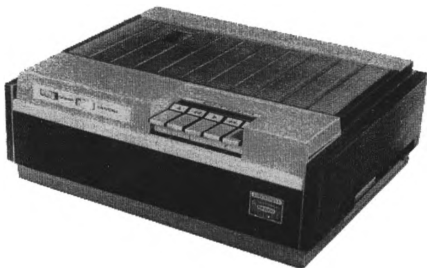
Рис. 36. Макет кассетного видеомаягнитофона