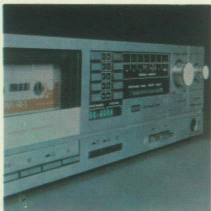
Tape Deck stereo

This stereo cassette tape deck adds taped stereo and mono to your music system.