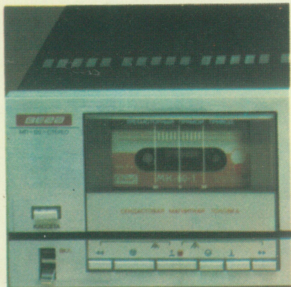
Магнитофон- приставка стерео

Магнитофон-приставка предназначен для воспроизведения и записи программ на кассеты типа МК-60 и МК-90 и на аналогичные импортные кассеты. Работает с подключением внешнего усилителя и акустических систем.